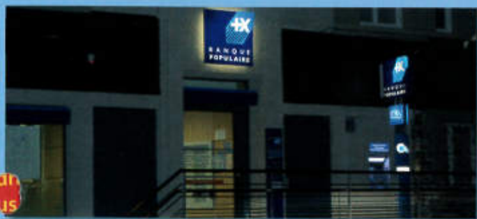
Inauguration de l'Agence BANQUE POPULAIRE à Saillagouse - Le 6 juin 2011

En outre, vous pouvez déposer votre courrier jusqu'à 14h45 au Centre de Tri Postal situé sur la Zone d'Activités de Saillagouse.