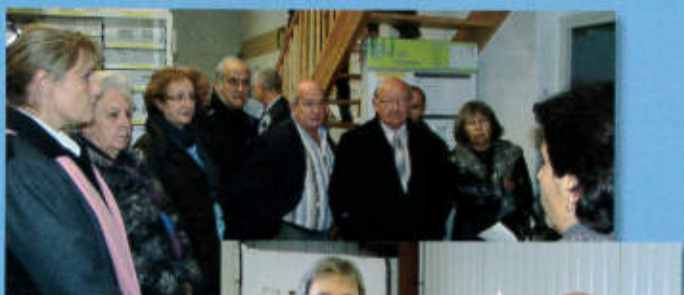
Le 18 novembre 2011, le Centre de Tri Postal fête ses « 1 an » dans les nouveaux locaux à Saillagouse