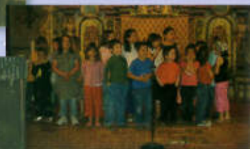
Chorale des enfants