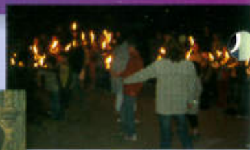
Feux de la Saint-Jean et de la Saint-Pierre