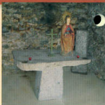
Un autel en granit offert par les soeurs d'Angoustrine grâce à l'Abbé Barthier que nous remercions, a été installé à la chapelle de Védriagnans.

La tâche n'étant pas finie, nous invitons toutes les personnes désirant s'impliquer dans cette restauration à apporter leur participation en se rapprochant de la trésorière Madame CAR-CASSONNE, rue des jardins à Saillagouse. Tél. : 04 68 04 70 14. MERCI A TOUS.