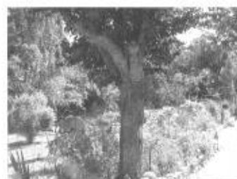
dans la catégorie jardin

Toutefois il fallait désigner quatre gagnants dans chaque catégorie :