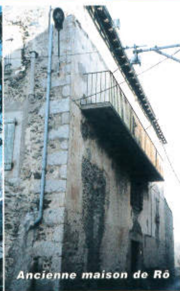
Ancienne maison de Rô